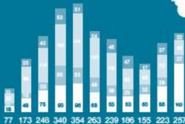
Dimension rechter Gewalt 2004 bis 2014

Eine Gewalttat ist immer dann eine Straftat, wenn eine körperliche Schädigung von Personen beabsichtigt oder vollendet wird. Darüber hinaus gelten Sachbeschädigungen und Brandstiftungen, die indirekt auf eine Schädigung bestimmter Personengruppen abzielt sowie Nötigungen und Bedrohungen mit erheblichen Folgen für die betroffene Person als eine Straftat. Es handelt sich um eine rechte Gewalttat, wenn die Umstände der Tat oder die Einstellung der Täter_innen darauf schließen lassen, dass sie sich gegen eine Person aufgrund bestimmter, von den Täter_innen abgeleiteter Merkmale richtet. Die hier abgebildeten Zahlen bilden jene sichtbare Spitze des Eisbergs rechter Straftaten ab, die Menschen in ihrer körperlichen Unversehrtheit verletzt. Viele rechte Gewalttaten bleiben unerkannt oder finden keinen Eingang in die Zahlungen. Es muss deshalb von einer enormen Dunkelziffer rechter Gewalttaten auszugehen.